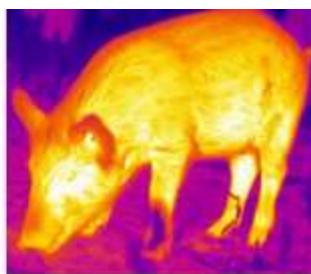
Кабан 1815 Метров