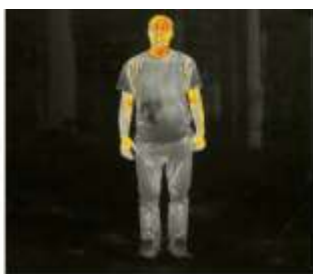
Человек 2594 Метров