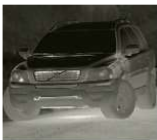
Автомобиль 6220 Метров