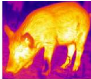
Кабан 1623 Метров