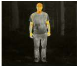
Человек 2597 Метров