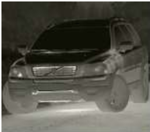
Автомобиль 6014 Метров

Комфортный угол обзора позволяет без труда вести долгое наблюдение за всей областью, без постоянного поиска.