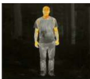
Человек 1280 Метров