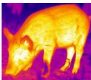
Кабан 1020 Метров