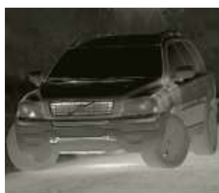
Автомобиль 1858 Метров

Комфортный угол обзора позволяет без труда вести долгое наблюдение за всей областью, без постоянного поиска.