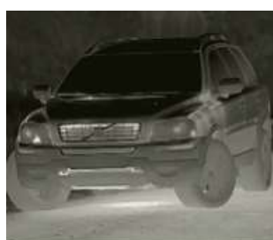
Автомобиль 6485 Метров