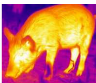
Кабан 1987 Метров