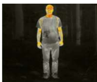
Человек 2597 Метров